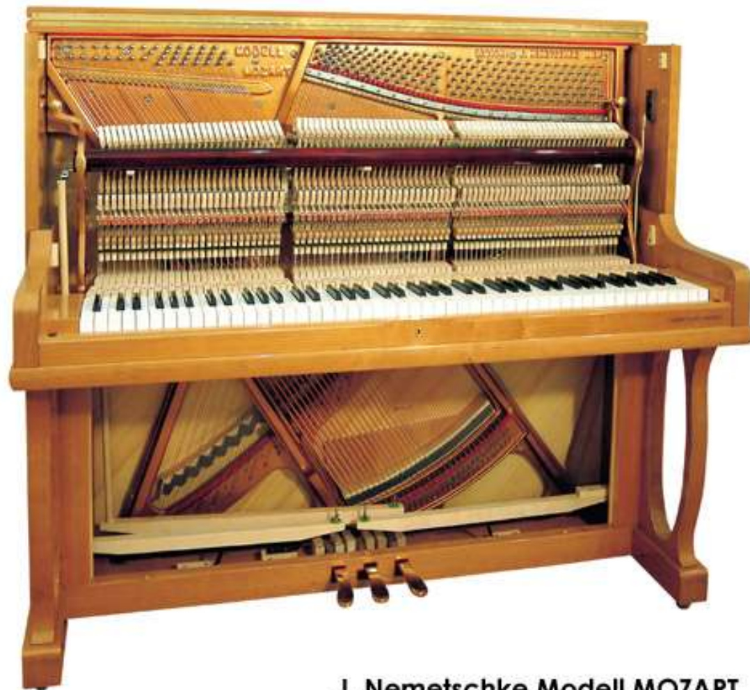
J. Nemetschke Modell MOZART

Τα όρθια πιάνο , οι χορδές των οποίων φέρονται σε κάθετη διάταξη με το επίπεδο των πλήκτρων